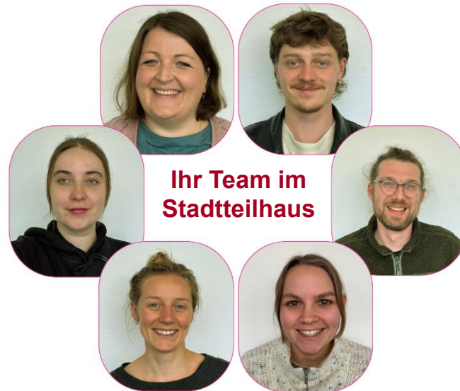
Ihr Team im Stadtteilhaus

Ostendstraße 83 70188 Stuttgart Tel: 0711 286 83 99 sth.ost@awo-stuttgart.de www.awo-stuttgart.de IBAN: DE98370205000006742002